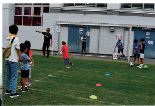
烏森サッカークラブの キックターゲット