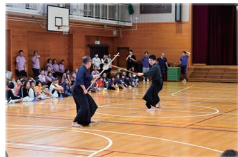
ほうそういんのゆうそうじゆつ 宝蔵院流槍術の演舞