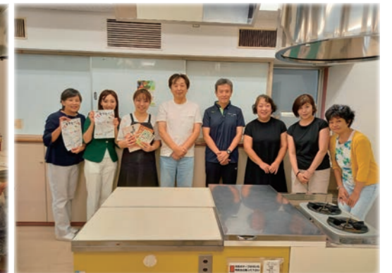
最後にスタッフみんなで