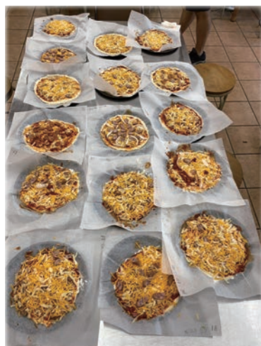
同じ材料でもいろんなピザが完成

今年も烏森住区住民会議では、様々な活動を行いました。青少年育成部、地域活動部、スポーツ振興部、総務部、広報部の部員が時間をつくって打ち合わせや作業をし、様々な活動を進めています。烏森住区まつりやファミリーコンサートは実行委員会として、各部の代表が力を合わせて行いました。 自分の仕事の他、町会や民生委員など地域の仕事やPTAとかけもちしている方も多いですが、地域の皆様や子供たちの嬉しそうな笑顔を楽しみに、アイデアを出し合い、力を合わせています。様々な活動の様子をご紹介します。