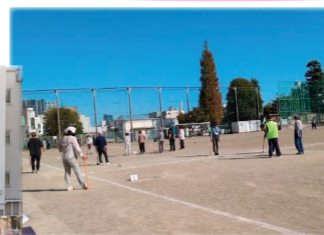
東山中での試合風景