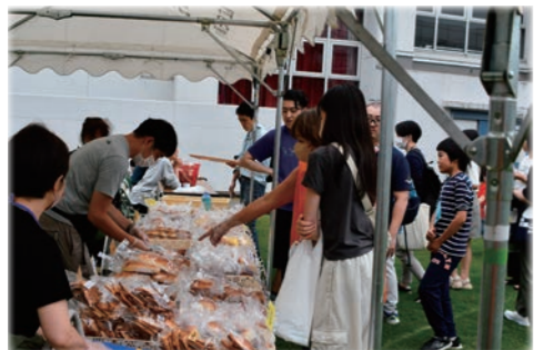
かみよん工房のパン屋さん