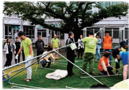
テント張りもみんな