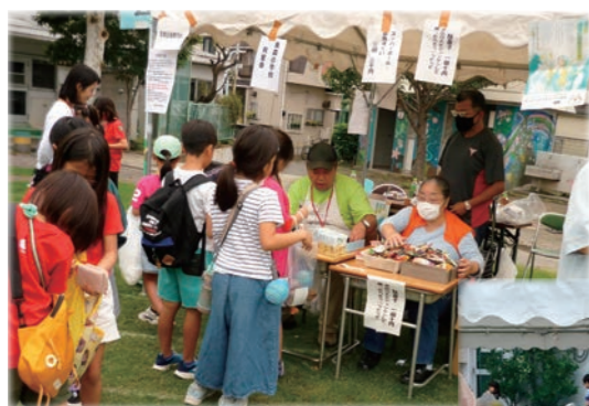
烏森小学校同窓会の スーパーボールすくい 駄菓子屋さん