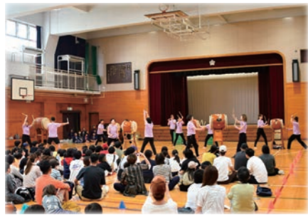
大人太鼓 朝は雨が降っていたので、オープニングは体育館で行いました