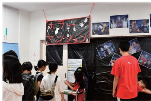
烏森学童保育クラブのおばけやしき