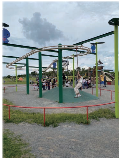
ぶら下がりコース